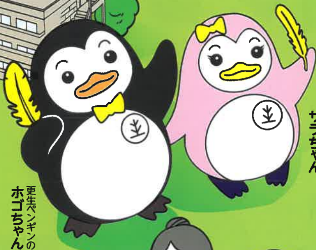
更生ペンギンの ホゴちゃん