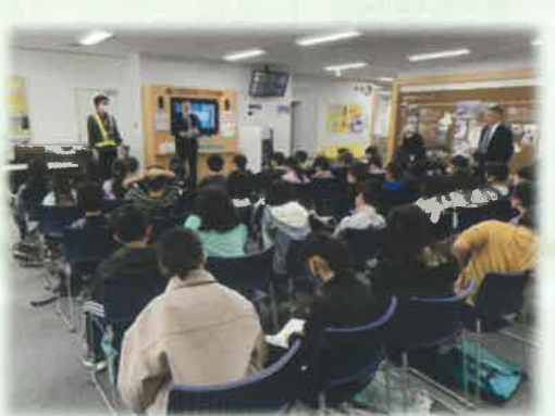
<栄小学校4年生による空港見学>