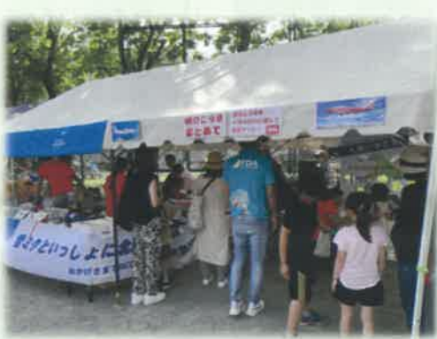
<ハッチふれあいフェスティバル>

令和5年度は、地域のお祭りへのブース出展や地元小学生の空港見学など、多くの皆さまにご協力いただき、取り組んできました。改めましてお礼申し上げます。 令和6年度もこれまで以上に、丘珠空港や周辺エリアの活性化に取り組んでまいりますので、ご協力よろしく願いいたします。