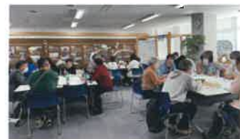
＜昨年のワークショップの様子＞

そこで、まちづくり構想に対するご意見やアイデア等を幅広くいただきたく、ワークショップを下記のとおり開催いたします。ぜひご参加いただき、まちづくりの方向性や取組などに関するご意見をお聞かせください。