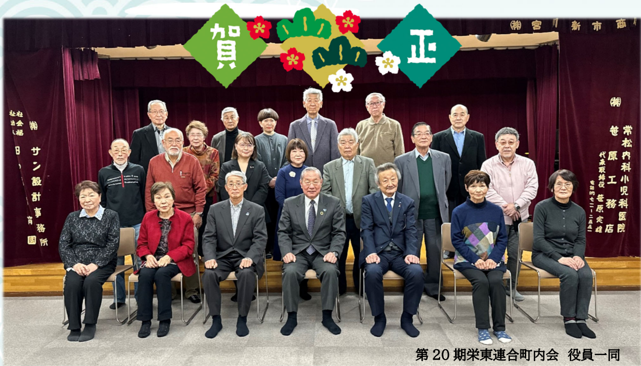
第20期栄東連合町内会 役員一同