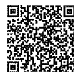
アンケート 修正方法