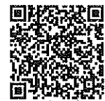
アンケート 回答方法