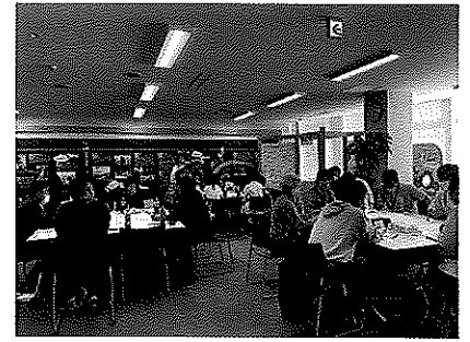
＜ワークショップの様子＞

今後の予定として、幅広いテーマで行う意見交換会も下記のとおり開催していきますので、ご参加ください。