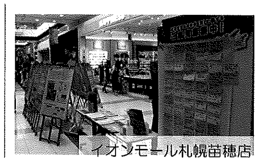
イオンモール札幌苗穂店