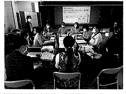
【グループワークの様子】

情報提供・情報共有の場にもなり、今後一緒に地域づくりを進めていくための貴重な一歩になりました。