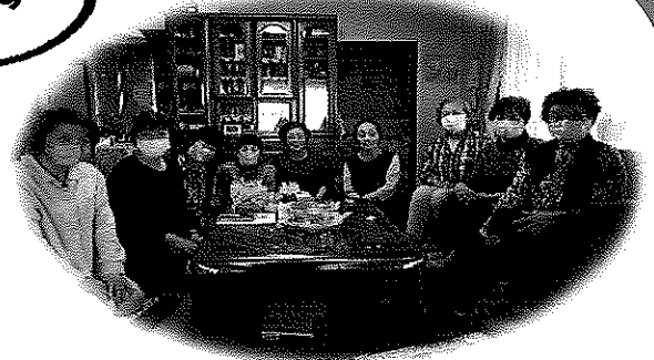
【第1回サロンの記念写真】