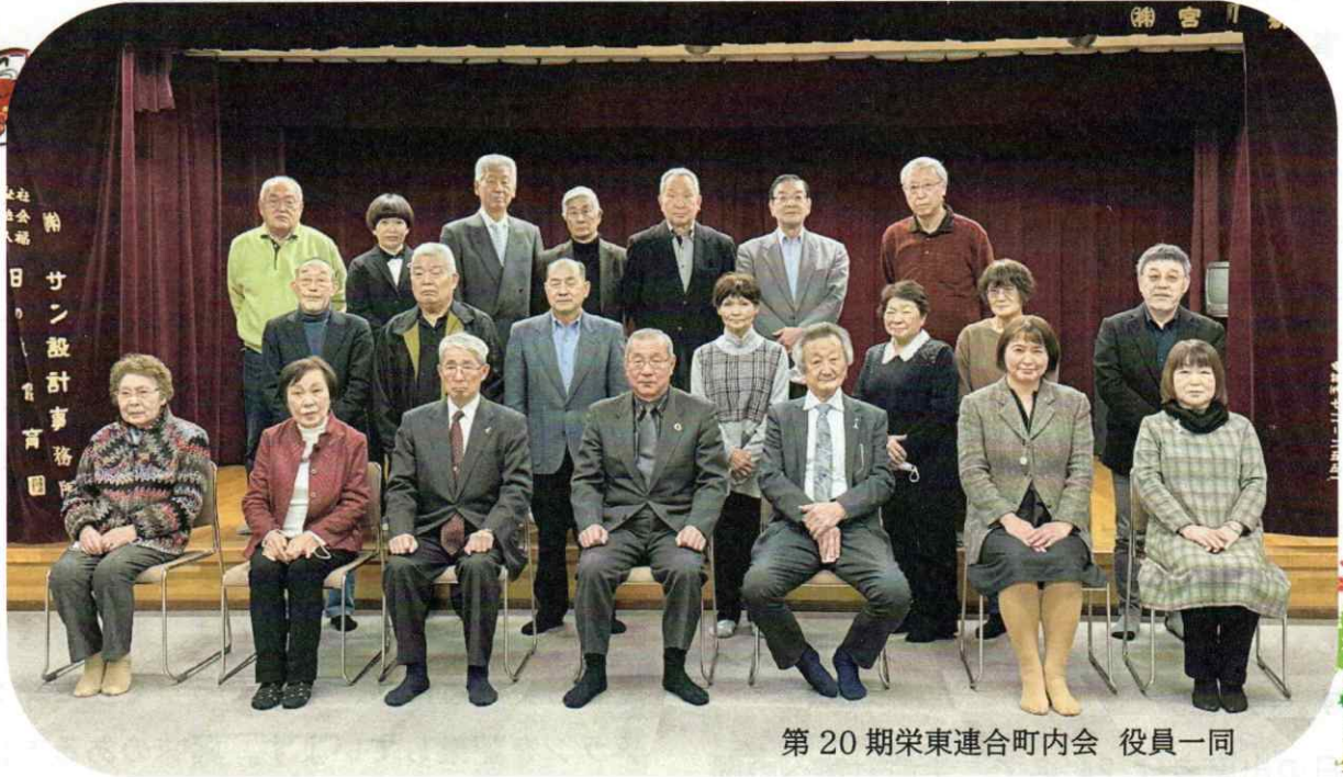
第20期栄東連合町内会 役員一同