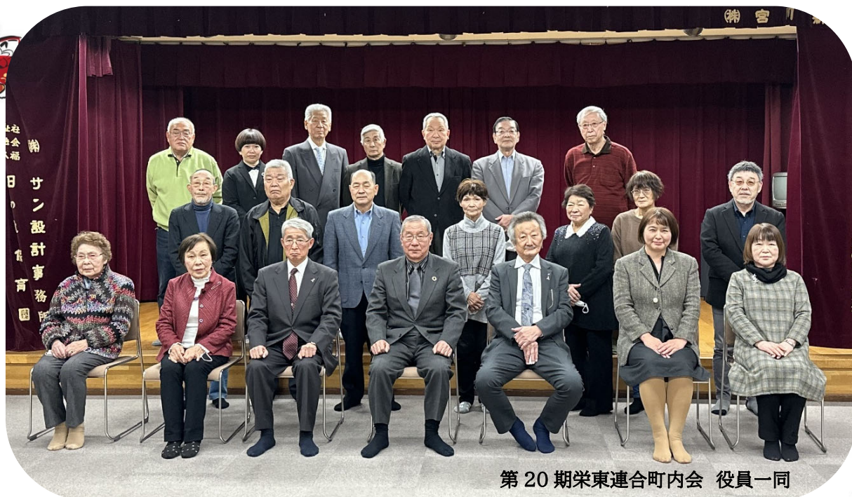
第20期栄東連合町内会 役員一同