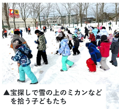
▼育成委員と一緒に雪だるまづくり

ソリ滑り用の山づくりには、前日から手作業で準備をするなど、青少年育成委員や民生委員・児童委員のみなさんのおかげで、参加者のみなさんは、冬空の下、楽しいひとときを過ごしました。