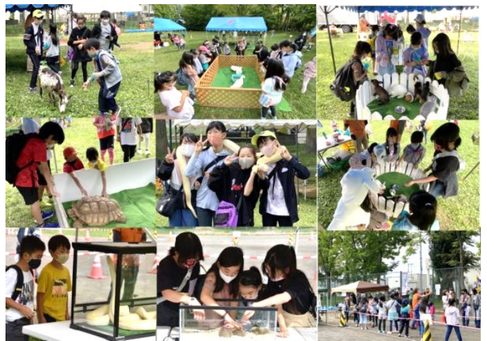
▲昨年のひのまる公園移動動物園の様子